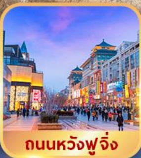
ถนนหวังฟู่จิ่ง