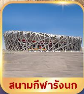
สนามกีฬารังนก