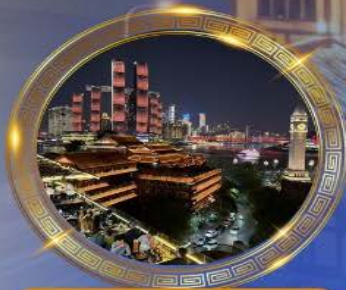
มือคำร้านอาหารวิวหลักลัน