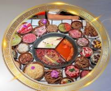
บุฟเฟ่ต์มือโหลงซิ่ง