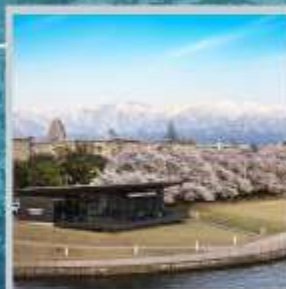
"TOYAMA KANSUI PARK"