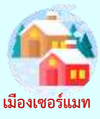
เมืองเซอร์แมท

เช้า บริการอาหารเช้า ณ ห้องอาหารของโรงแรม (11)