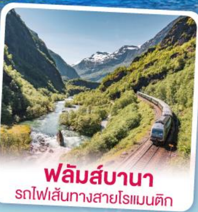
พลัมส์บานา รถไฟเส้นทางสายโรแมนติก