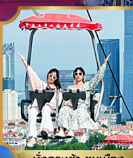
นั่งกระเช้า ชมเมือง