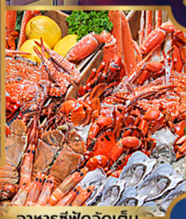
อาหารซีฟู้ดจัดเต็ม

บุฟเฟ่ต์เบียร์ไม่อื่น + ซีฟู้ด + บิงย่างเกาหลี