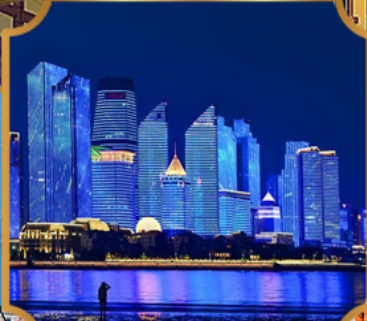
หาดโซเบอร์ฟังก์