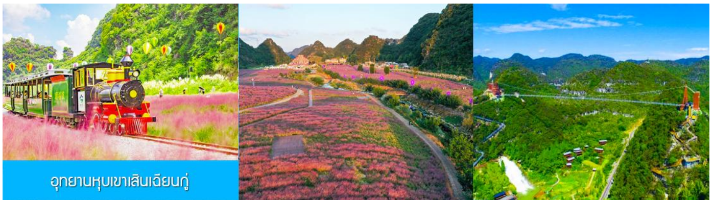
อุทยานหุบเขาเสินเจียนกู่

เที่ยง รับประทานอาหารกลางวัน ณ ภัตตาคาร (มือที่ 2)