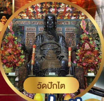
วัดปักโต