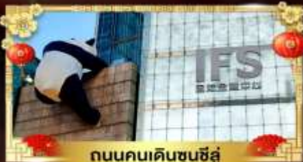
ถนนคนเดินชุนชี่อู๋

เที่ยวอุทยานสวรรค์ระดับ 5A จิวจ้ายโกว "กู๋เขาสีดรุณี" อุทยานชื่อดังเหนียงชาน