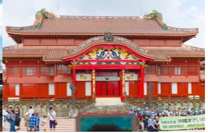
Shurijo Castle (external facade)