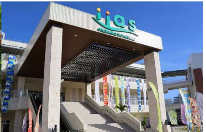
iias Okinawa Toyosaki