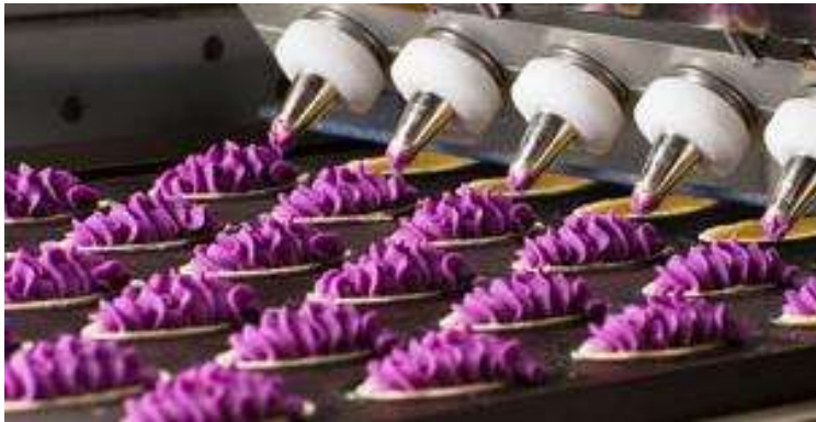
Okashigoten Confectionary Factory Line