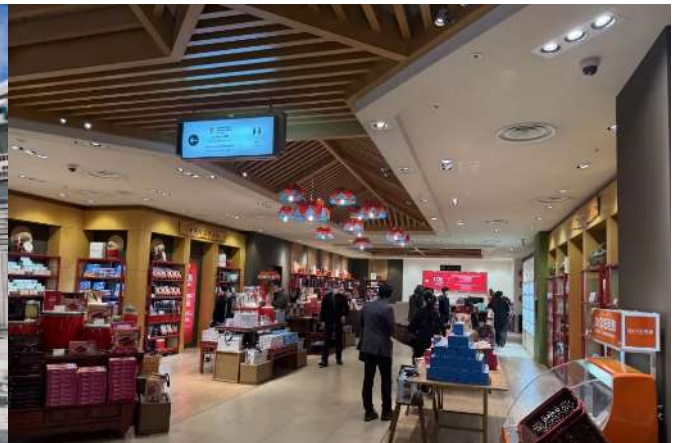
Japan Tax Free Shop

คำ อีสระรับประทานอาหารค่ำตามอัยาศัย ณ ห้องอาหารที่เรือจัดเตรียมไว้