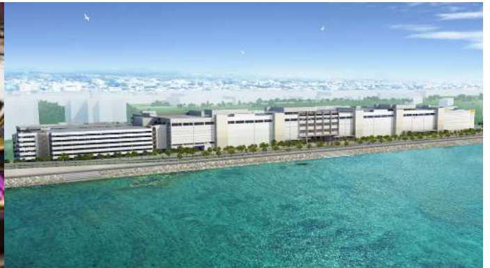
SAN-A Urasoe West Coast Parco City