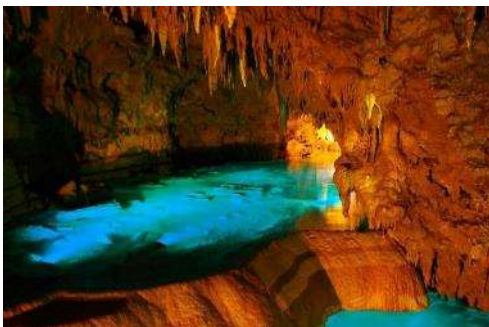
Gyokusendo Kingdom Village

ราคาผู้ใหญ่ 1,900 NTD/ท่าน ราคาเด็ก 1,700 NTD/ท่าน