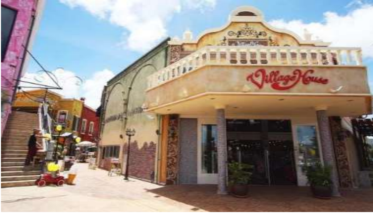
Mihama American Village