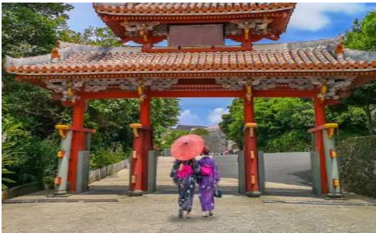
Shurijo Castle (External façade)

ราคาผู้ใหญ่ 1,700 NTD/ท่าน ราคาเด็ก 1,500 NTD/ท่าน