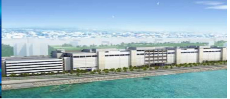
SAN-A Urasoe West Coast Parco City